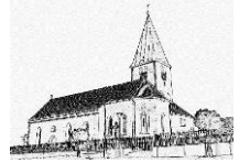
St. Martinus Geratskirchen