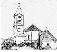
Johannes d. Täufer Mitterskirchen