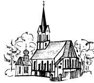
Mariä Heimsuchung Unterdietfurt