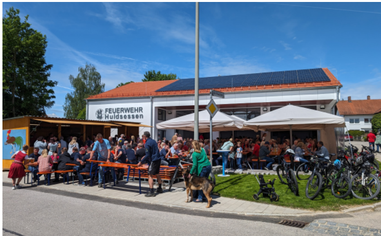
Einen wahren Ansturm erlebte die FFW Huldessen beim Tag der offenen Tür. Die Besucher konnten das Feuerwehrhaus besichtigen und ließen sich die von der FFW Huldessen angebotenen Speisen und Getränke schmecken