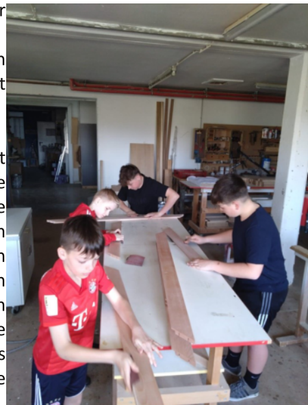
Die fleißigen Handwerker bei der Arbeit